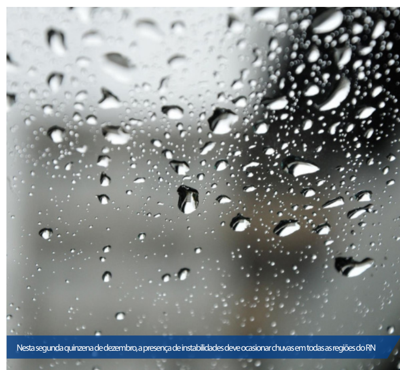
Nesta segunda quinzena de dezembro, a presença de instabilidades deve ocasionar chuvas em todas as regiões do RN

Para o período chuvoso de 2018, que deverá começar entre o fim de fevereiro e início de março, as primeiras análises mostram que existe uma forte tendência de chuvas próximas da normalidade climatológica, com índices variando entre 800mm e 1000mm, no total, dependendo da região.