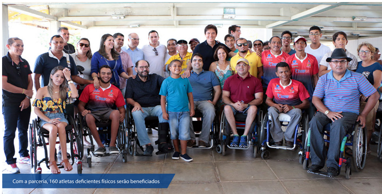
Com a parceria, 160 atletas deficientes físicos serão beneficiados

Instituição que atende 160 portadores de deficiência tem agora, oficialmente, acesso a parque esportivo e instalações administrativas