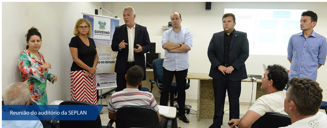
Reunião do auditório da SEPLAN