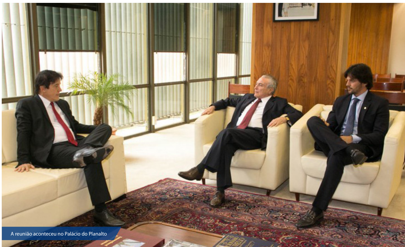
A reunião aconteceu no Palácio do Planalto

Na ocasião, o presidente Temer determinou que os secretários do Governo do RN se reúnam com representantes da equipe econômica federal para formatarem como se dará a transferência dos recursos. O RN pleiteia transferências federais extraordinárias para a atualização da folha de servidores.