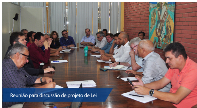
Reunião para discussão de projeto de Lei

Entre os objetivos da Lei podemos destacar: Ampliar e qualificar a ATER no Rio Grande do Norte; Contribuir para o desenvolvimento rural sustentável; Pro-